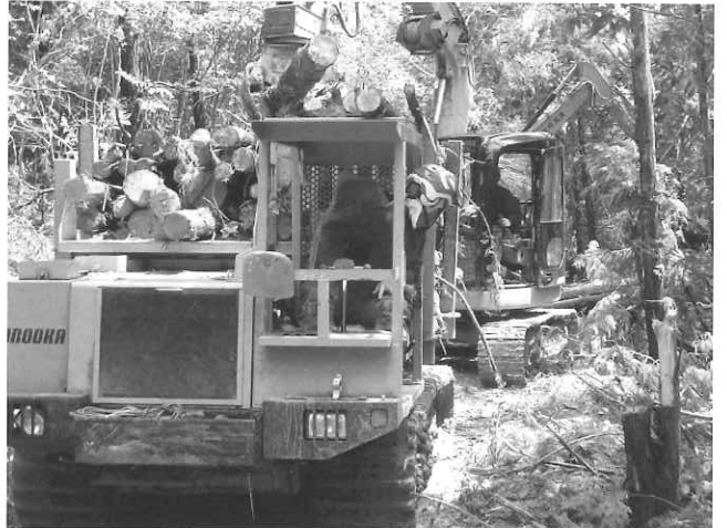
➤溝渕林業(株)にて フォワーダを安全に運転する技術、ロープワークなどを、現場でバリバリ働いている本校の卒業生から教わっていました。